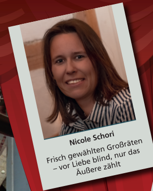
Nicole Schori Frisch gewählten Großbräten – vor Liebe blind, nur das Äußere zählt

17. August (Premiere) 19./20./24./26./27./ 31. August 2022